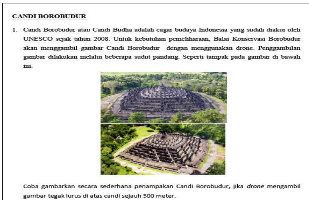
Gambar 1. Soal Sebelum Revisi

Prototype 1 divalidasi oleh validator yang ahli dibidang matematika dan oleh guru mitra. Tim validator memeriksa konten, konteks, dan bahasa pada soal. Setelah itu, soal diberikan kepada siswa pada proses one-to-one . Berikut merupakan hasil revisi soal dan proses one-to-one sebelum dan sesudah revisi.