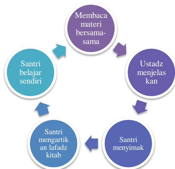
Gambar 5. Alir pembelajaran sorongan dan bandongan

wazan, mauzun, bina' terkait bentuk kata santri mengalami kemajuan yang signifikan. Adapun pada kitab jurumiah, para santri terdapat peningkatan yang ditandai dengan angka 75%, hal ini menandakan kemajuan pada pembelajaran kitab jurumiah cukup bagus. Adapun pada kitab-kitab yang lainnya seperti kitab sullam, safinatun naja, santri juga mengalami hal yang sama. Oleh karenanya pembelajaran dengan pendekatan sorongan dan bandongan membantu pembelajaran santri mengaji dan mengakaji kitab kuning.