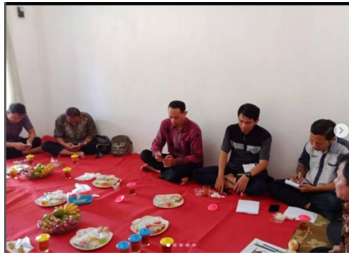
Gambar 3. Para Ustadz Rapat

Para ustadz mengadakan rapat terkait peningkatan hasil belajar santri, bisa dikatakan rapat bulanan yang di laksanakan di rumah salah satu rumah ustadzah. Semua para asatidz (ustadz dan ustadzah), menyampaikan semua masukan dan sarannya dalam mengupayakan pembelajaran kitab yang efektif. Bagaimana dengan pendekatan pembelajaran yang relevan dengan masa kini, misal pendekatan sorongan dan bandongan di konsep pembelajaran yang menyenangkan.