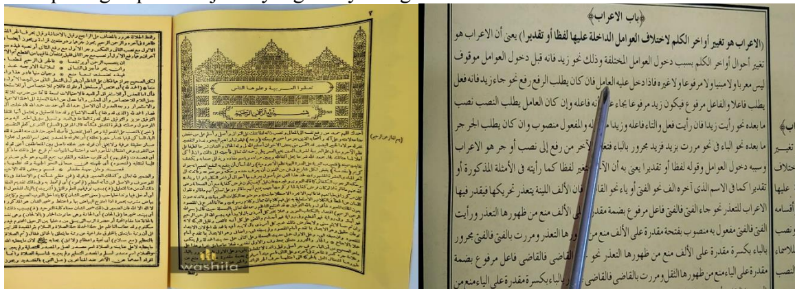
Gambar 4. Kitab jurumiah yang di kaji.

Para ustadz mengadakan rapat terkait peningkatan hasil belajar santri, bisa dikatakan rapat bulanan yang di laksanakan di rumah salah satu rumah ustadzah. Semua para asatidz (ustadz dan ustadzah), menyampaikan semua masukan dan sarannya dalam mengupayakan pembelajaran kitab yang efektif. Bagaimana dengan pendekatan pembelajaran yang relevan dengan masa kini, misal pendekatan sorongan dan bandongan di konsep pembelajaran yang menyenangkan.