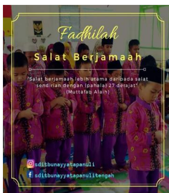
Gambar 4. Hadis tentang Fadhilah (Keutamaan) Salat Berjamaah.

Peserta didik SDIT Bunayya melakukan kegiatan salat berjamaah setiap hari untuk mengaplikasikan materi pembelajaran PAI yang diberikan di kelas. Hal ini didukung dengan penyampaian hadis tentang fadhilah atau keutamaan dari shalat berjamaah kepada peserta didik, baik melalui lisan maupun pajangan di dinding sekolah serta media sosial milik SDIT Bunayya.