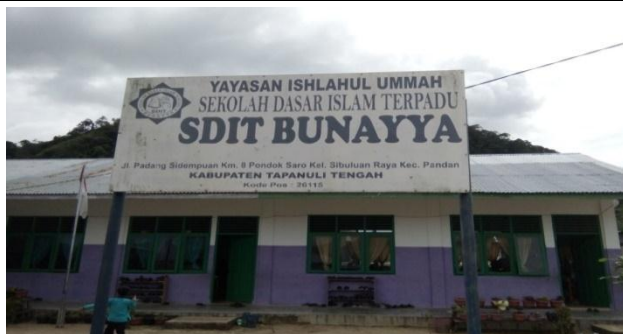
Gambar 3. SDIT Bunayya Kabupaten Tapanuli Tengah

Awal berdirinya SDIT Bunayya yaitu pada tahun 2014 dan bernama SD Bunayya. Setelah memasuki tahun 2015, sekolah ini mengganti nama menjadi Sekolah Dasar Swasta Islam Terpadu (SDIT) Bunayya, dikarenakan pada tahun 2015 sekolah ini masuk pada sebuah perkumpulan organisasi Jaringan Sekolah Islam Terpadu (JSIT) dan nama resminya tercatat di Kementerian Pendidikan dan Kebudayaan (Kemendikbud), yaitu Sekolah Dasar Swasta Islam Terpadu Bunayya dengan nomor pokok sekolah nasional (NPSN): 69893103 pada tanggal 9 April 2015.