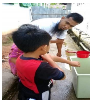
Gambar 5. Pembinaan Cara Berwudu di SDIT Bunayya

Pihak sekolah di SDIT Bunayya melakukan pembinaan cara berwudu yang baik pada semua peserta didik agar dapat diketahui dengan baik. Kegiatan pembinaan ini dibimbing langsung oleh guru kepada peserta didik untuk dicontohkan cara berwudhu yang baik dan benar. Berikut dokumentasi kegiatan pembinaan cara berwudu.