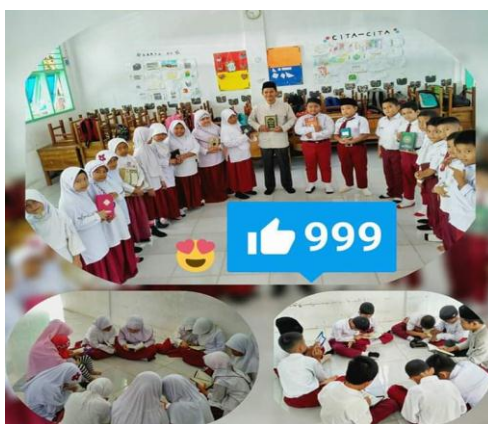
Gambar 6. Interaksi Peserta Didik SDIT Bunayya dengan Al-Qur'an

Berdasarkan riset di sekolah, diperoleh data bahwa pihak sekolah mendidik peserta didik agar cinta Al-Qur'an dengan membiasakan membaca dan menghafal Al-Qur'an. Kegiatan ini dilaksanakan secara variatif, baik dengan sistem halaqah maupun disimak langsung bacaannya oleh guru pendamping.