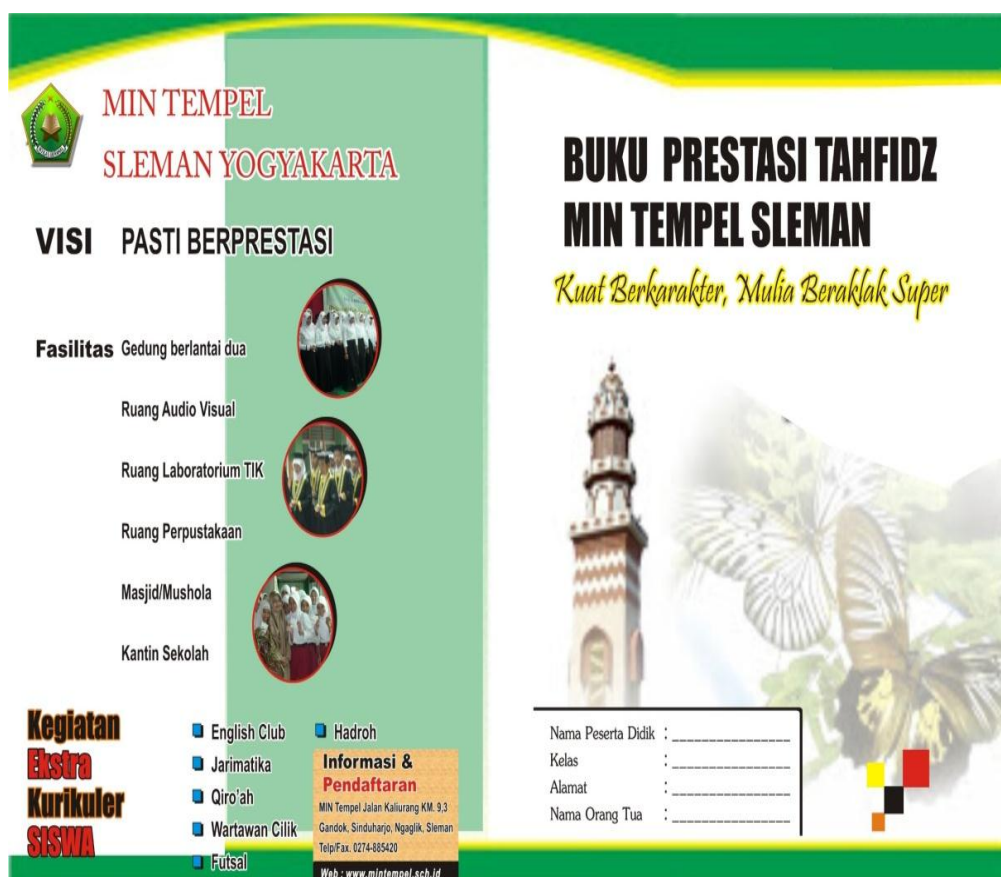
Gambar 3. Buku Prestasi Tahfidz

Pengawasan mempunyai peranan atau yang penting dalam manajemen, dengan mempertimbangkan mempunyai fungsi untuk menguji apakah pelaksanaan program kelas tahfidh Al-Qur'an, tertib, terarah dan sesuai dengan tujuan yang diinginkan atau tidak. Walaupun kegiatan planning , organizing dan actuating baik, tetapi tidak dilakukan kegiatan controlling dengan baik, tertib dan berkelanjutan maka tujuan yang telah ditetapkan tidak akan tercapai. Untuk itu pada program kelas tahfidh Al-Qur'an di MIN 2 Sleman Yogyakarta agar dapat berjalan sesuai dengan tujuan yang telah ditetapkan maka dibuatlah buku Prestasi Tahfidh Al-Qur'an yang meliputi catatan perkembangan tahfidh dan catatan perkembangan bacaan, seperti pada contoh berikut ini: