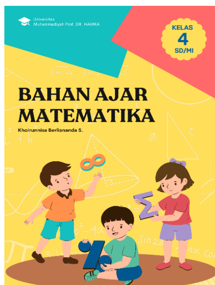
Gambar 1. Cover Bahan Ajar Interaktif

Penelitian ini berupaya untuk mengatasi permasalahan mengenai kemampuan literasi matematika peserta didik dengan menggunakan bahan ajar interaktif pada materi pecahan. Materi dan soal-soal latihan dalam bahan ajar interaktif ini sesuai dengan ketentuan materi pecahan kelas IV dan model soal berbasis literasi. Bahan ajar interaktif berisi beberapa media, seperti gambar, video, audio, animasi, dan game education yang memungkinkan peserta didik sebagai pengguna dapat turut memberikan respons langsung terhadap materi sehingga mampu meningkatkan kemampuan dan pemahaman peserta didik. Desain bahan ajar interaktif dibuat dengan memanfaatkan platform canva . Canva digunakan untuk mengembangkan bahan ajar karena aplikasi ini dapat berfungsi sebagai mediator yang mampu menciptakan bahan ajar interaktif, dengan banyaknya menu yang dapat dimanfaatkan untuk menyampaikan materi secara lebih visual dan interaktif. Hasil dari desain canva kemudian diekspor ke dalam flipbook heyzine . Heyzine adalah salah satu fitur pada aplikasi canva yang dapat dimanfaatkan untuk menggabungkan beberapa media interaktif ke dalam desain bahan ajar yang telah disusun. Hasil dari perancangan bahan ajar interaktif tersebut diubah bentuknya menggunakan fitur interaktif yang berisi bermacam-macam topik pelajaran mengenai pecahan, soal-soal latihan berbasis literasi, game education , video pembelajaran, aktivitas pembelajaran, dan daftar pustaka tersaji pada gambar di bawah ini.