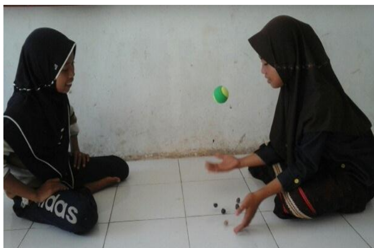
Gambar 3. Aktivitas melambungkan bola pada permainan ma'ggurecceng

Berdasarkan hasil wawancara dengan S1B mengungkap bahwa alat yang digunakan dalam permainan ma'ggurecceng berupa satu bola dan batu-batu berjumlah mulai 4 sampai 6 butir.