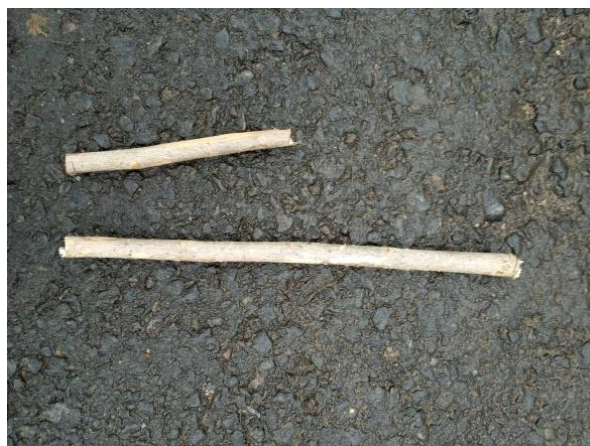
Gambar 4. Alat permainan Ma'cciccu

Hasil dokumentasi dari alat permainan ma'cciccu