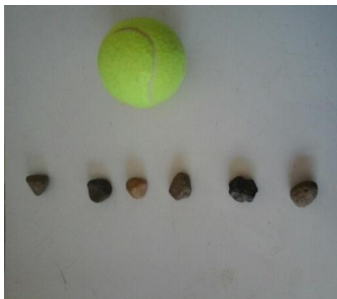
Gambar 2. Alat permainan Ma'ggurecceng

Berikut hasil dokumentasi dari alat permainan ma'ggurecceng