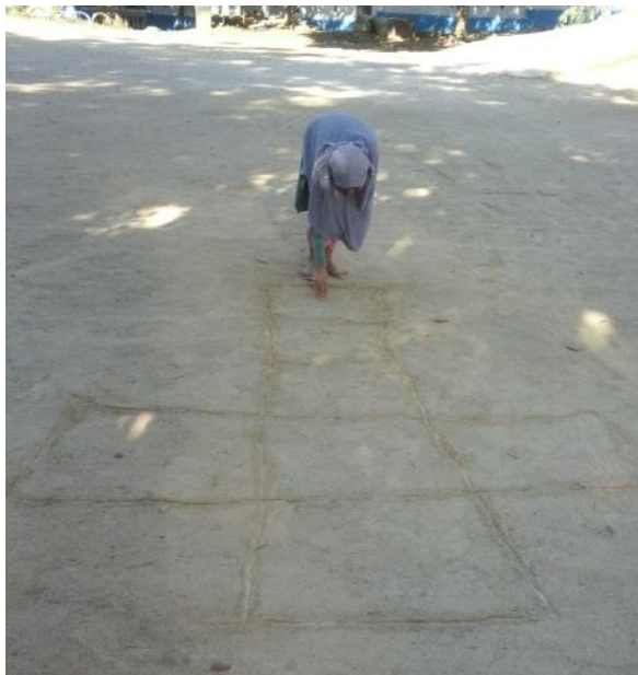
Gambar 1. Arena Permainan ma'belle

Berikut hasil dokumentasi alat dan arena dari permainan ma'belle