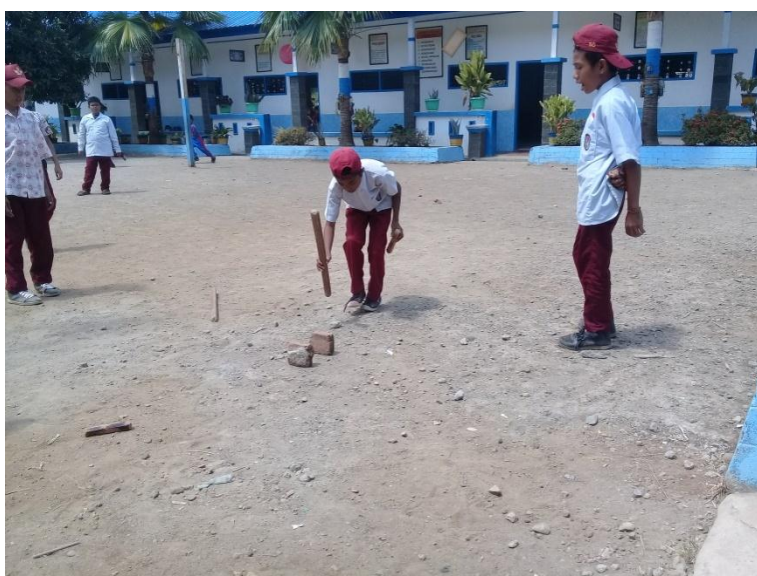
Gambar 5. Kegiatan Mengukur pada permainan Ma'cciccu

Berdasarkan hasil wawancara dengan S1C mengungkap bahwa alat yang digunakan dalam permainan ma'cciccu berupa kayu atau pipa dua ukuran. Selanjutnya dilakukan wawancara terkait aturan dan tahapan permainan ma'cciccu . Berikut adalah transkrip hasil wawancara peneliti dengan subjek penelitian.