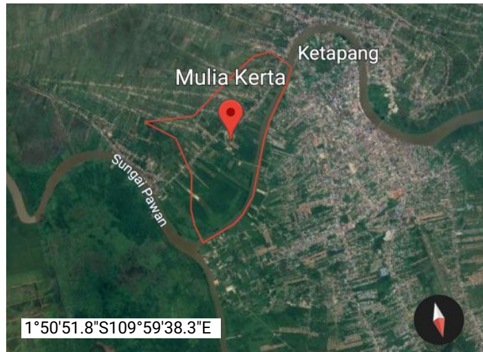
Gambar 1. Peta wilayah kelurahan Mulia Kerta kabupaten Ketapang

Wawancara dilakukan dengan dua belas informan yang terdiri dari lima orang informan kunci yang memenuhi kriteria dan tujuh orang masyarakat Kelurahan Mulia Kerta Ketapang. Kriteria informan kunci (Martha & Kresno, 2016) yaitu: merupakan masyarakat etnik Melayu Mulia Kerta Ketapang; memiliki peran penting dan pengetahuan terkait penggunaan obat tradisional hipertensi etnik Melayu Kelurahan Mulia Kerta Ketapang; dapat ditemui dan memberikan informasi yang diperlukan dengan mudah; dan dapat menyampaikan informasi dengan bahasa sendiri (natural). Informan ditentukan dengan teknik snowball sampling . Snowball sampling merupakan teknik pengumpulan data melalui informan yang ditunjuk oleh informan lain dan terus berlanjut hingga data jenuh (Naderifar et al., 2017). Wawancara dilakukan dengan pedoman berupa lembar wawancara yang dikembangkan dari penelitian sebelumnya berisi 10 pertanyaan dari tiga aspek yaitu aspek jenis tumbuhan obat untuk mengetahui identitas tumbuhan obat yang dimanfaatkan; aspek manfaat tumbuhan obat untuk mengetahui bagian yang digunakan dan cara pemanfaatan tumbuhan obat; aspek budidaya tumbuhan obat untuk mengetahui cara memperoleh informasi pemanfaatan dan tumbuhan obat (Ruqoyah, 2017).