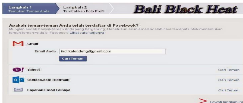
Gambar 4: halaman konfirmasi pertemanan