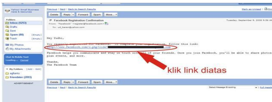
Gambar 5 : Halaman konfirmasi di Email