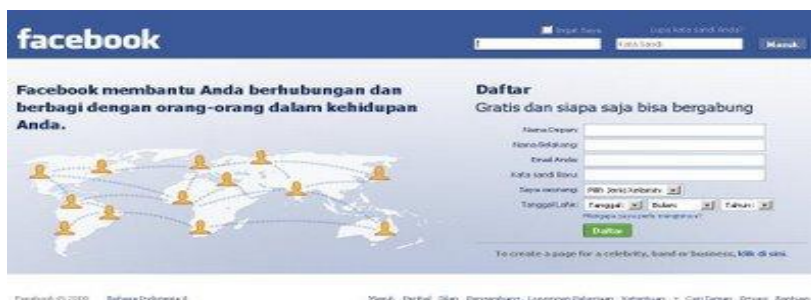
Gambar 2 : Halaman daftar / masuk akun facebook