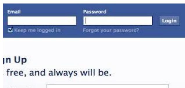
Gambar 6: Login Facebook