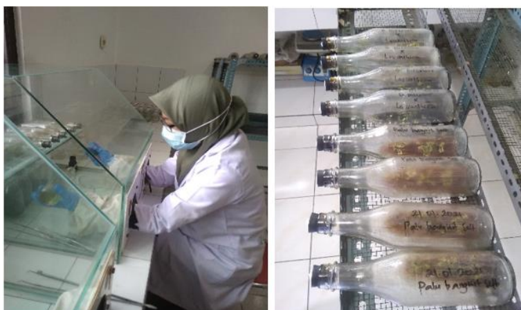
Gambar 5. Proses penjarangan dalam penelitian.

Proses ini dilakukan tiga kali dalam kurun waktu satu tahu, setiap tiga bulan sekali dilakukan pergantian media yang bertujuan untuk melakukan perbanyakan. Botol penjarangan yang sudah memiliki banyak bibit, disterilkan dalam enkas bersamaan dengan botol yang berisi media. Bibit dikeluarkan dalam botol, kemudian diletakkan pada cawan petri. Setiap botol yang berisi media dimasukkan bibit dengan menggunakan pinset panjang ( scalpel ) dalam keadaan tersebar tidak bergerombol, bibit yang jatuh tidak masuk cawan petri maka tidak boleh dimasukkan dalam botol penjarangan baru, karena sudah terkontaminasi. Botol penjarangan yang diambil bibitnya, kemudian ditutup rapat diolesi dengan betadine untuk merekatkan.