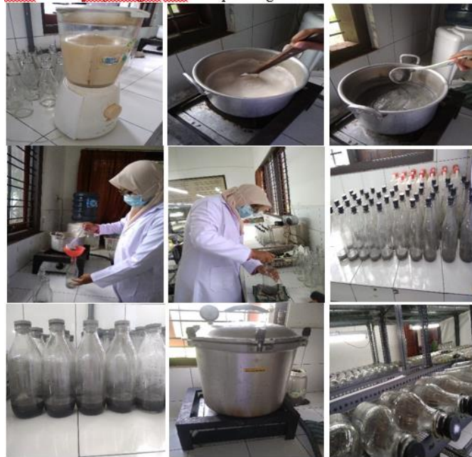
Gambar 3. Pembuatan dan sterilisasi media yang digunakan dalam penelitian.

yang lebih khusus yang dinamakan media Vacin dan Went (VW). Media VW terdiri dari unsur hara makro dan mikro dalam bentuk garam-garam anorganik dengan jumlah yang pas atau sesuai untuk pertumbuhan tanaman anggrek secara khusus.