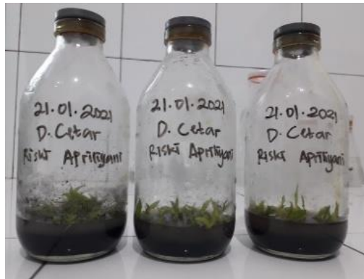
Gambar 6. Hasil transplanting dalam penelitian.

Satu botol diisi dengan 15 tunas anggrek dengan posisi dalam keadaan tertancap akarnya pada media walaupun tidak dalam. Jika sudah dilakukan transplanting , botol disimpan dengan keadaan berdiri tegak kurang lebih selama tiga bulan, jika umurnya sudah memungkinkan maka siap untuk dijual atau dilakukan aklimatisasi di green house .