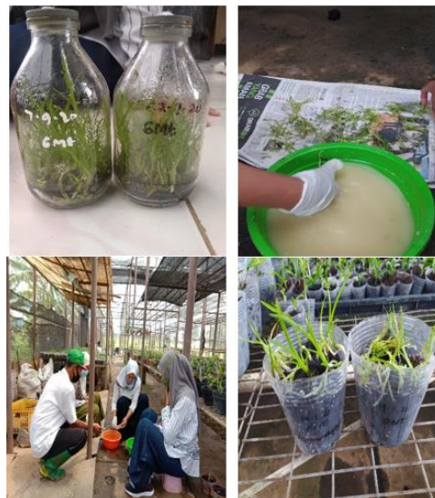
Gambar 7. Proses aklimatisasi dalam penelitian.

Proses buka botol dalam biologi dikenal dengan aklimatisasi. Anggrek yang berada di botol yang umurnya satu tahun siap untuk dilakukan pemindahan media tanam ke lingkungan yang lebih ekstrim dibandingkan di dalam botol. Pada saat dilakukan proses ini, anggrek yang saya lakukan aklimatisasi adalah anggrek jenis Grematophyllum . Sebelum ditaman pada poli pot yang berisi media kadaka, anggrek dikeluarkan dari botol dan direndam menggunakan fungisida yang fungsinya untuk menghindari anggrek dari gangguan fungi (Gambar 7).