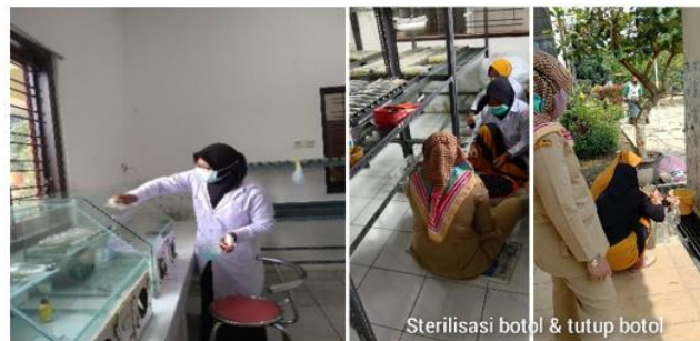
Gambar 1. Proses sterilisasi di laboratorium UPTD Kebun Dinas Pertanian Kota Semarang.