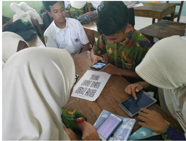
Gambar 2. Peserta Didik Menscan QR Code

Selanjutnya untuk melatih kemampuan psikomotorik peserta didik, guru menugaskan membuat infografis dan wajib diunggah dalam platform Padlet . Melalui Padlet , berbagai karya peserta didik dapat ditampilkan. Peserta didik juga bisa saling memberikan penilaian maupun komentar layaknya sosial media. Hal ini memicu peserta didik untuk kreatif dalam membuat karya infografis semenarik mungkin.