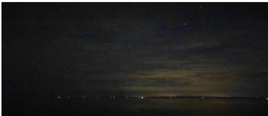
Gambar 4.4 Polusi cahaya di Pelabuhan Bajoe, Bone.

Pada gambar diatas terdapat polusi cahaya lampu. Semakin banyak pemasangan lampu, maka akan semakin banyak pula polusi cahaya, yang dapat mengganggu pengamatan langit di malam hari karena cahaya terbiaskan ke langit. sehingga kita tidak dapat membedakan antara fajar dan polusi cahaya.