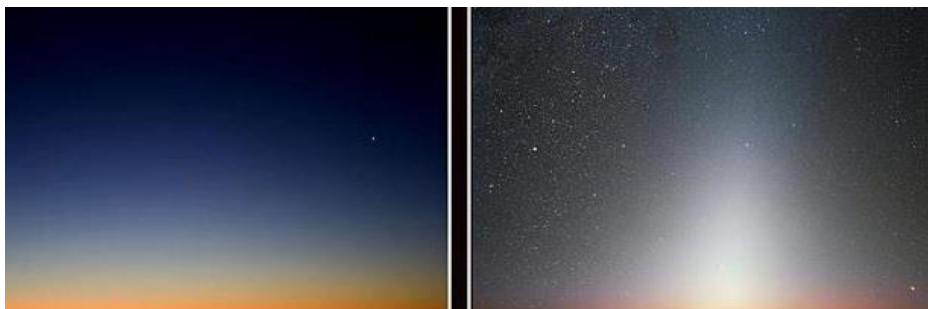
Gambar 4.3 Fajar Sadiq dan Fajar Kadzib