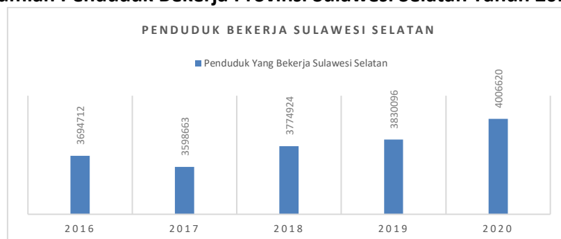
Gambar 2: Jumlah Penduduk Bekerja Provinsi Sulawesi Selatan Tahun 2016-2020 (Jiwa)

Sumber: Sulawesi Selatan dalam Angka, 2021