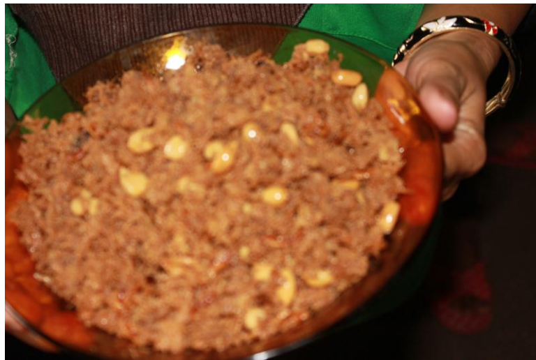
Gambar 6. Abon Telur Itik Produksi Kelompok Wanita Tani Ternak Libureng

Produk abon telur yang diproduksi oleh kelompok wanita tani ternak libureng memperlihatkan karakteristik abon yang tidak berbeda dengan abon daging secara umum.