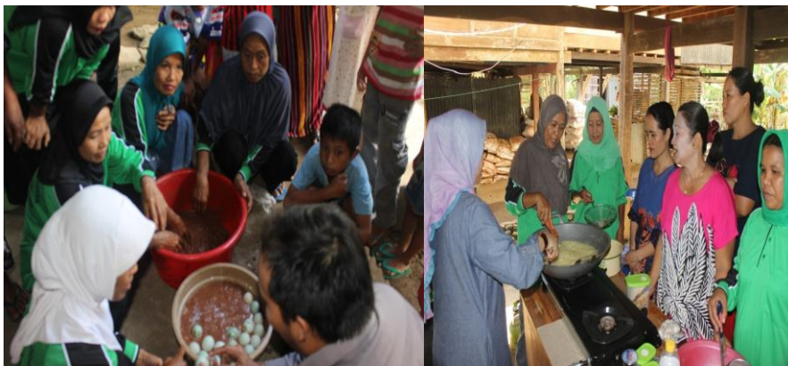
Gambar 4. Praktek pembuatan produk olahan telur itik

(b) peserta pelatihan antusias mengikuti pemaparan materi