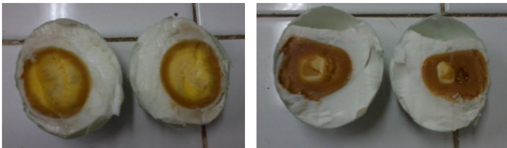
Gambar 5. Perbandingan penampilan, tekstur, dan rongga udara telur asin; dengan asap cair (kiri) dan tanpa asap cair yang dibeli di pasar (kanan)

Pada telur asin asap cair tidak ditemukan rongga udara, tekstur dan penambilan lebih halus dibanding dengan telur asin biasa tanpa asap cair yang dibeli dari pasar (Gambr 5),