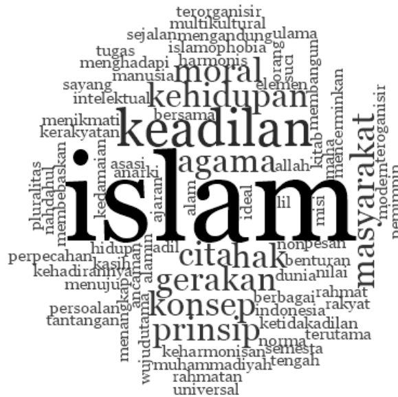
Gambar 2. Visualisasi Islam sebagai Rahmatan lil Alamin