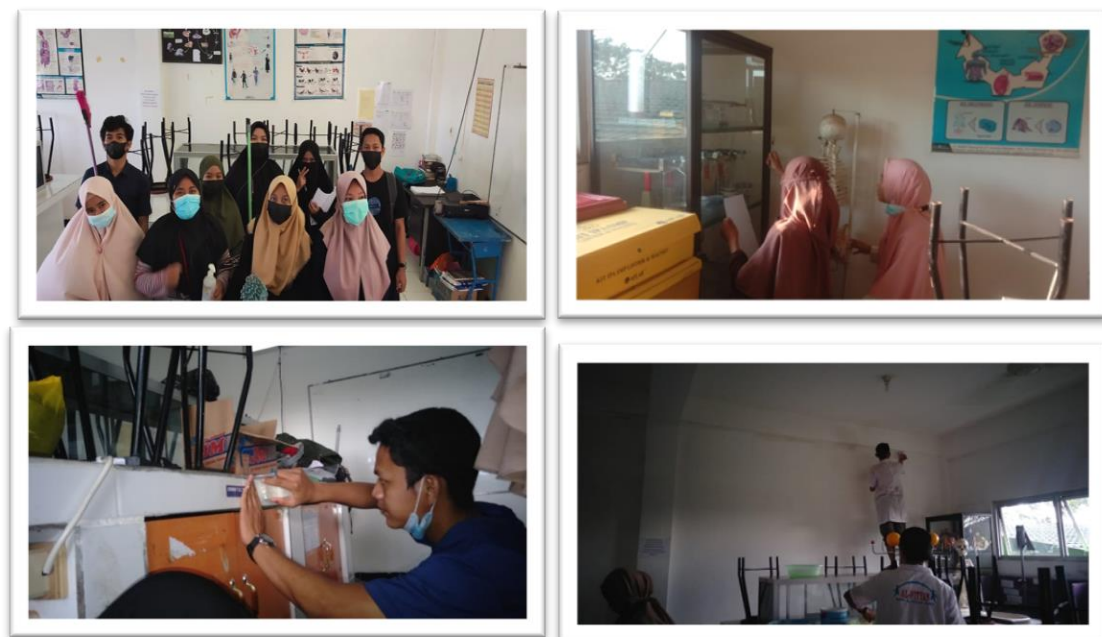
Gambar 2. Foto pelaksanaan Kegiatan oleh tim bedah Lab

Melakukan foto bersama oleh Tim Bedah Lab sebelum melakukan pembedahan Laboratorium di SMPIT Al-Fityan School Gowa, seperti pada Gambar 2.