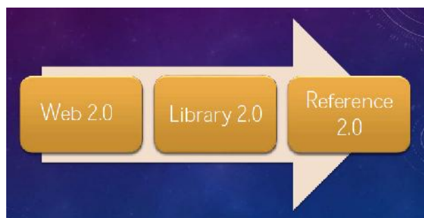
Gambar 1. Perkembangan layanan Referensi 2.0

dan kemudian mempengaruhi pelayanan referensi menjadi Referensi 2.0. Apabila dilihat dari model layanannya, apabila layanan referensi menggunakan prinsip Web 2.0 maka dapat disebut dengan layanan Referensi 2.0 (Tajer, 2009:25-27).