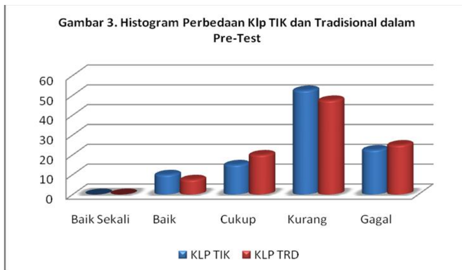
Gambar 3. Histogram Perbedaan Kelompok TIK dan Tradisional dalam Pre-test

Dalam uji efektivitas, peneliti menggunakan pendekatan kualitatif dan kuantitatif atau yang biasa disebut dengan mixed method . Namun, unsur kualitatifnya lebih banyak dibandingkan dengan kuantitatif. Dalam hubungannya dengan uji efektivitas, skor yang diperoleh kelompok TIK dan kelompok tradisional (tidak menggunakan TIK) dalam pre-test dan post-test dihitung berdasarkan analisis kuantitatif. Sedangkan, reaksi masing-masing kelompok terhadap pembelajaran dikumpulkan melalui observasi dan wawancara dan dianalisis secara kualitatif. Adapun perbandingan antara kelompok TIK dan Tradisional dapat dilihat dalam histogram di bawah ini.