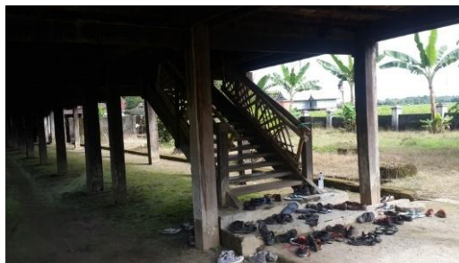
Gambar 6. Model tangga pada rumah adat Saoraja Lapinceng

Tangga utama memiliki 15 anak tangga, bangunan ini dibuat berdasarkan angka ganjil. Angka ganjil merupakan angka yang sakral yang dihubungkan dengan angka tuhan yaitu ganjil. Mereka percaya bahwa sesuatu yang ganjil akan digenapkan oleh Tuhan. Ini merupakan kepercayaan yang tumbuh ditengah-tengah masyarakat saat itu. Bentuk dari anak tangga utama disusun rapat dan lebar, ini berfungsi agar kuda dengan mudah naik ke teras rumah Sao Raja Lapinceng. Tangga ini terbuat dari kayu bitti dengan ukuran kayu yang cukup tebal. Kemiringan tangga dibuat tidak terlalu miring sehingga kudapun dengan mudah bisa naik ke teras. Material tangga ini hanya menggunakan kayu dan diperkuat dengan pasak kayu, namun sekitar tahun 1982 terjadi perbaikan besar besar pada bangunan ini sehingga ada beberapa material seperti pasak kayu di ganti dengan pasak besi, serta perletakan tangganya yang berasal dari batu yang disusun diganti dengan semen.