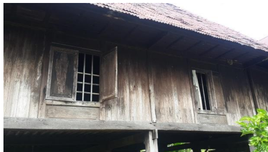
Gambar 5. Model Jendela pada Rumah Adat Saoraja Lapinceng

Menurut Marwati dan Sri Andriani (2017) bahwa jendela pada rumah bugis tidak mirip antar daerah. Begitu juga jendela pada rumah saoraja Lapinceng yaitu memiliki ukuran yang besar yaitu rata-rata jendelanya besar dan lebar. Pada masa kerajaan, jendela hanya memiliki jeruji kayu yang berjumlah 5 jeruji sebagai pelindungnya tanpa menggunakan daun pintu pada jendela ini sebagai penutupnya sehingga tampak dari luar, ruangan dalam rumah selalu terlihat oleh masyarakat setempat, sehingga pada saat hari dimana masyarakat melihat sang putri telah mendapatkan jodohnya, masyarakat akan melihat sang putri berkeliaran yang menandakan akan ada pernikahan di Saoraja Lapinceng.