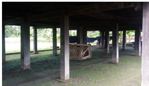
Gambar 3. Kolom Struktur Rumah Adat Saoraja Lapinceng