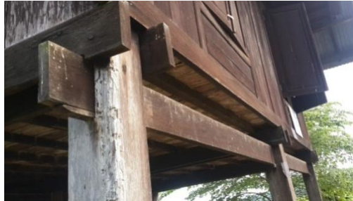
Gambar 4. Pattolo' dan arateng

Tangga diletakkan di depan atau belakang, dengan ciri-ciri: