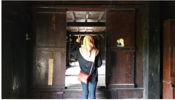
Gambar 2. Pintu yang Menghubungkan Ruang Utama dan Ruang Tengah

Secara keseluruhan, rumah Lapinceng menggunakan 35 tiang dengan 23 jendela. Tinggi rumah dari permukaan tanah sekitar 6,5 meter, dengan tinggi keseluruhan tiang mencapai 15 meter hingga pucuk atap.