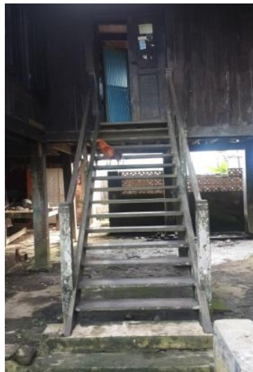
Gambar 7. Tangga belakang menuju dapur

Tangga ini merupakan penghubung langsung dari bawah rumah menuju dapur. Kemiringan tangga belakang ini lebih miring dari tangga depan karena hanya diperuntukkan untuk manusia saja, selain itu pada tangga juga dipasang raling sebagai pegangan bagi pengguna rumah. Sedangkan jumlah anak tangga yaitu berjumlah 15 Anak tangga. Sama seperti tangga utama juga dari raling tangga belakang rumah ini beberapa materialnya sudah menggunakan besi. Serta perletakkannya yaitu penggunaan semen.