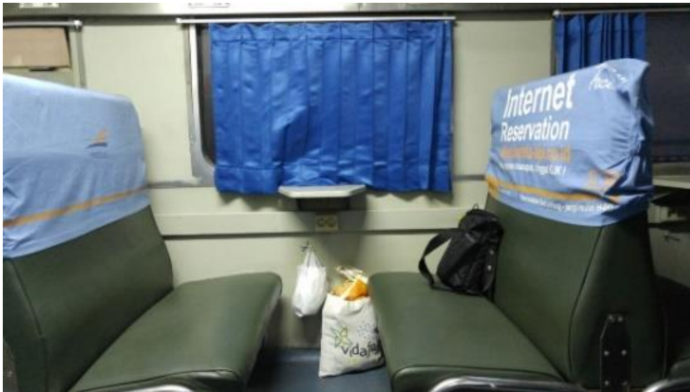
Gambar 2: Meletakkan Barang Pribadi pada Suatu Tempat yang Ditinggalkan Sementara Sebagai Pembentuk Ruang (Teritori)

Aktualitas ruang teritori ini bisa dilakukan dengan berbagai cara, diantaranya: tulisan, penanda, pagar, dan lain-lain. Bentuk dan konsep teritori ini bersifat subjektif sehingga masih bisa diganggu oleh individu lain. Menurut Laurens (2004), pelanggaran teritori dapat diindikasikan dalam bentuk invasi yaitu mengambil kendali atas teritori orang lain. Selain itu, kekerasan juga merupakan pelanggaran teritori yang bertujuan bukan untuk memiliki namun hanya sebatas gangguan. Dan bentuk lainnya, pelanggaran teritori dapat berupa kontaminasi yaitu meninggalkan keburukan pada teritori individu lain, misalnya membuang sampah pada area publik, merusak fasilitas publik, dan lain-lain (Laurens, 2004).