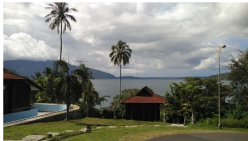
Gambar 2. Seminung Lumbok Resort di Desa Lumbok, Lampung Barat

Seminung Lumbok Resort ialah suatu objek wisata berupa tempat penginapan yang dilengkapi berbagai fasilitas seperti kolam renang, convention hall , restaurant dan karaoke, dermaga perahu, cottage , area permainan anak, serta bungalow VIP. Ketika berkunjung ke wilayah ini, terdapat tiga bangunan besar dan megah dengan taman yang tertata dengan indah, serta dua bangunan yang lebih kecil bernuansa tradisional Lampung lengkap dengan kolam renang di sisinya seakan menyambut siapapun yang datang ke Seminung Lumbok Resort yang terletak di tepi Danau Ranau, Lampung Barat. Kelompok Sadar Wisata (Pokdarwis) Mupadu di Pekon Kagungan, Lumbok Seminung telah menyediakan 14 home stay yang bisa dipilih wisatawan yang ingin bermalam. Selain itu juga tersedia home stay lain yang juga dikelola masyarakat setempat. Selain itu terdapat berbagai paket kegiatan menarik bagi pengunjung, seperti memancing, menombak ikan, hiking , dan lainnya serta beberapa pondok makan dan lesehan pun sudah tersedia di wilayah ini.