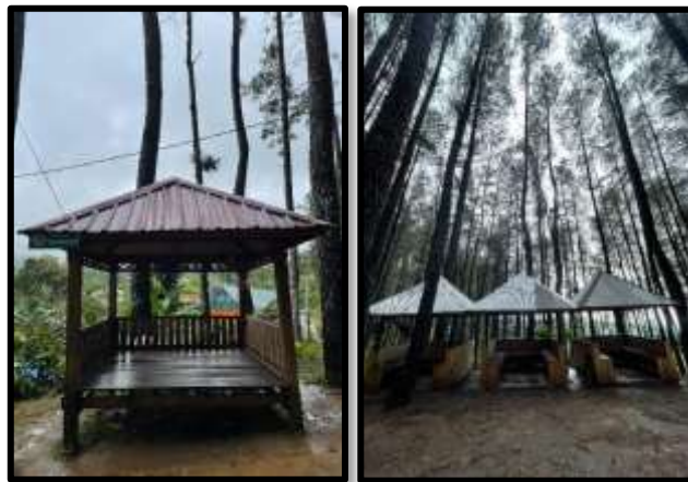
Gambar 2. Cazebo

Gazebo menjadi fasilitas peristirahatan wisatawan sambil menikmati keindahan panorama lokasi yang indah dan sejuk. Jenis sarana ini disiapkan sebagai tempat istirahat dan menghabiskan waktu, sambil menikmati keindahan pemandangan. Gazebo di ekowisata hutan pinus Bulu Tanah terdapat 4 unit dengan ukuran 2,5mx3 m. Satu unit gazebo dapat menampung 8-10 orang.