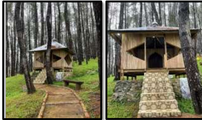
Gambar 3. Musholah

https://journal.uin-alauddin.ac.id/index.php/saintiskom