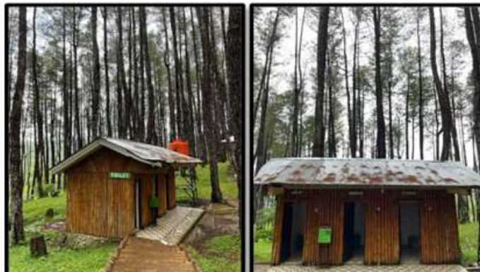
Gambar 4. Toilet

Sesuai dengan kondisi eksisting yang ada, ekowisata hutan pinus Bulu Tanah memiliki 3 unit toilet khusus untuk laki-laki, perempuan, pengelola dan masing-masing toilet sudah memiliki fasilitas kloset dan air bersih dengan kondisi yang baik.