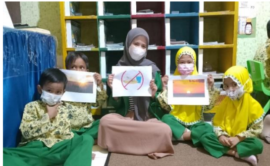
Gambar 1. Foto Bersama Menggunakan Media Kertas Bergambar

moral dan nilai-nilai agama melalui sikap-sikap dari tokoh yang ada dalam cerita. Dalam penyampaian nilai moral melalui cerita, seorang guru selain harus paham dengan nilai moral dan nilai-nilai agama anak.