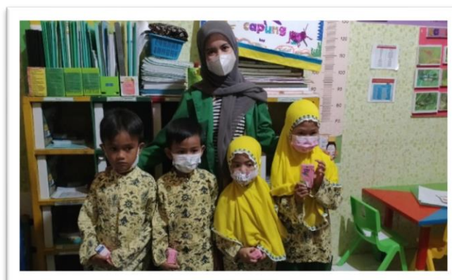
Gambar 3. Dokumentasi Pemberian Reward kepada Anak