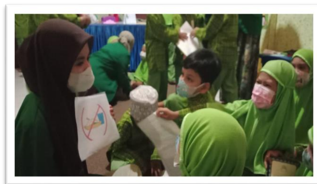
Gambar 2. Proses Penerapan Metode Bercerita