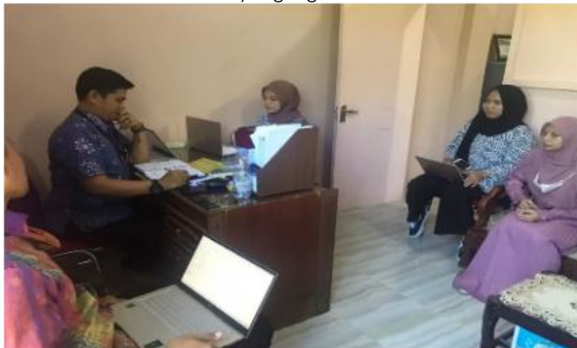
Gambar 1. Diskusi dengan pihak terkait difakultas

Pada saat pelaksanaan pengabdian terlihat mahasiswa sangat antusias dengan bertanya dan berdiskusi beberapa hal terkait Penulisan Karya Ilmiah. Beberapa mahasiswa masih kurang memahami terkait konsep Penulisan Karya Ilmiah. Beberapa mahasiswa juga menyampaikan keluhan-keluhan yang biasanya didapatkan seperti sulitnya mendapat jurnal yang terindeks dan juga sulit mengakses jurnal yang berbayar dan juga menentukan metode-metode yang digunakan.