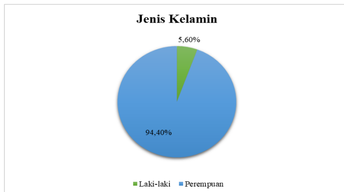
Gambar 1. Distribusi Responden Berdasarkan Jenis Kelamin pada Senam Anti Hipertensi

Berdasarkan gambar 1 distribusi responden berdasarkan jenis kelamin pada senam anti hipertensi, terdapat 18 responden. Responden perempuan sebesar 94,40% (17 responden), sedangkan laki-laki sebesar 5,60% (1 responden).