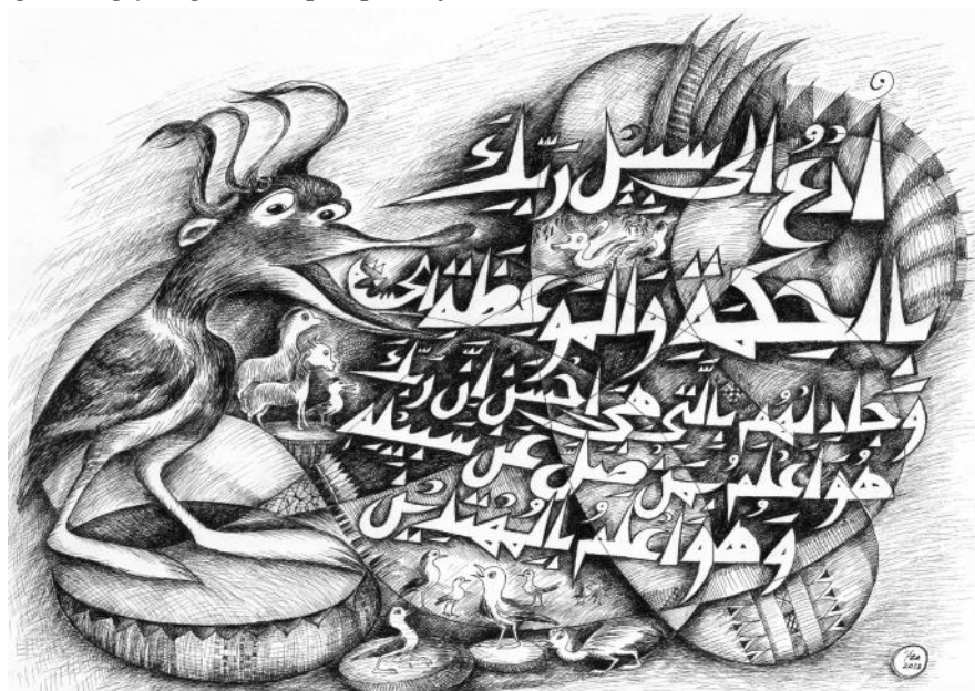
Dakwah Bil-Hikmah . karya Abd. Aziz Ahmad, 2013. Ukuran: 29,5 x 42 cm. Media: Tinta Cina di atas kertas. Koleksi: Dr. H.M. Sulthon, M.Ag. ( http://azakaligrafi.wordpress.com ).

yang lebih mengetahui tentang siapa yang tersesat dari jalan-Nya dan Dialah yang lebih mengetahui orang-orang yang mendapat petunjuk”