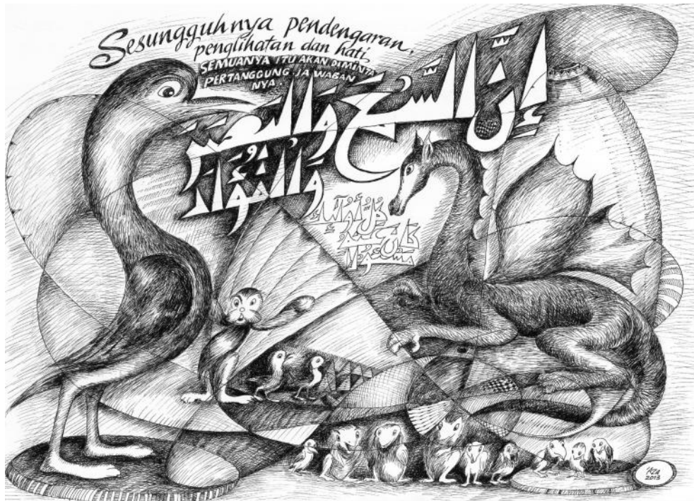
Contoh Lukisan Kaligrafi karya Abd. Aziz Ahmad berjudul: Semua Dipertanggungjawabkan (QS. Al Israa: 36), 2013. Ukuran: 30 x 42 cm. Media: Tinta Cina di atas kertas. Koleksi: Pribadi.

seseorang yang sedang memberikan uang kepada pengemis dan tema-tema islami lainnya.