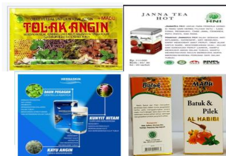
Gambar 3. Pemanfaatan Usnea dalam Berbagai Produk Obat Herbal Terstandar (OHT) Dan Kecantikan

Kayu angin juga digunakan untuk campuran obat luar dan kosmetik dalam, seperti jerawat, penghalus kulit, pengencang kulit, obat luka-luka, kudis, gatal-gatal dan sebagai pelancar peredaran darah, sedangkan untuk campuran obat tradisional dalam untuk bedak kulit yang dapat membuat kulit tampak segar berseri-seri dan cerah (Hutapea, J., dkk, 1992). Selain itu, Usnea juga ditemukan sebagai salah satu bahan produk Obat Herbal Terstandar (OHT) seperti tolak angin, janna tea hot, campuran madu al habibi dan herbaskin (Gambar 3). Usnea bisa digunakan untuk mengobati berbagai macam penyakit, karena mengandung berbagai macam metabolit sekunder. Setiap spesies Usnea mengandung perbedaan kandungan metabolit sekunder yang spesifik. Kandungan metabolit sekunder seperti lecanoric acid , dan usnic acid dimanfaatkan untuk antioksidan, antimikroba dan induksi apoptosis pada sel kanker (Luo, 2009; Backorova, 2012). Selain itu, usnic acid juga bisa digunakan untuk bahan pengawet.