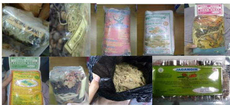
Gambar 2. Pemanfaatan Usnea dalam Produk Jamu Tradisional

masyarakat sunda sebagai jamu sariawan, disentri, masuk angin, erupsi kulit, kaku, nyeri haid, wasir, ibu melahirkan, dan bahan bedak wanita bangsawan (Noer, dkk, 2015).