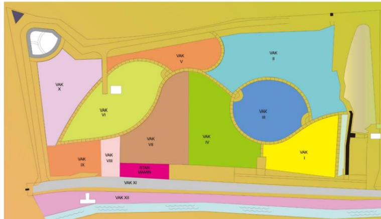
Gambar 3. Peta vak lokasi tumbuhan mangrove di KRM Surabaya

7 ha. Pada saat ini KRM Gunung Anyar telah terdapat 12 vak atau blok-blok koleksi yang akan dikembangkan sebagai zona koleksi untuk menanam koleksi tumbuhan mangrove dari berbagai jenis. Dari 12 vak tersebut telah dikoleksi sebanyak 26 nomor koleksi mangrove yang terdiri dari 82 spesimen tumbuhan baik yang berasal dari eksplorasi tumbuhan maupun yang merupakan koleksi spontan dari Kebun Raya Mangrove Surabaya. Peta vak lokasi tumbuhan mangrove dapat dilihat pada Gambar 3.