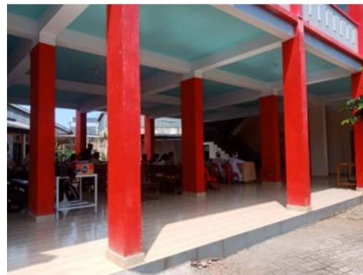
Gambar 5. Kolom

Kolom pada bangunan pendukung seperti pada gambar. Dimensi kolom pada dua bangunan ini berbeda. Dimensi ukuran kolom bangunan pendukung pertama memiliki dimensi 30 x 30 cm karena terdiri dari tiga lantai. Sedangkan bangunan pendukung kedua dimensi kolomnya itu 25 x 25 cm. Fungsi bangunan ini pada lantai dasar sebagai tempat kegiatan acara dan lantai dua berfungsi sebagai kelas. Bagian bawah bangunan juga difungsikan sebagai kantin.