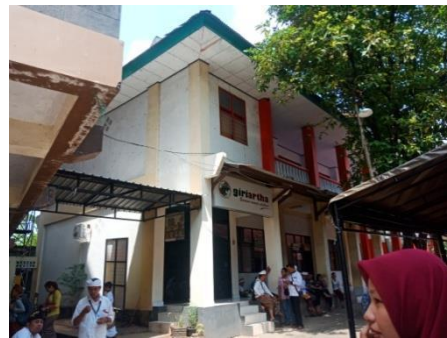
Gambar 17. Kantor