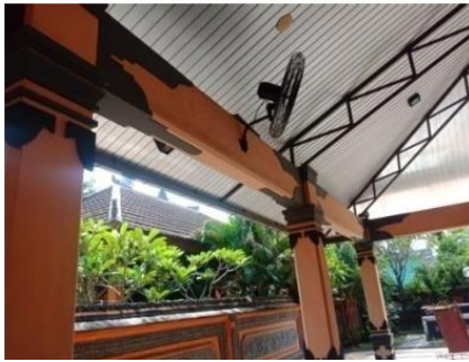
Gambar 6. Balok

Balok pada bangunan utama, berupa balok pengikat struktur utama. Hanya terdapat satu layer balok. Dari sistem struktur balok pada bagian ini susunanya lebih sederhana. Balok pada bangunan ini terdapat motif khas Bali namun terlihat sederhana. Balok pada bangunan ini berdimensi 30x20 cm.