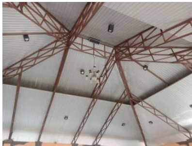
Gambar 8. Rangka Atap

Struktur atap yang digunakan pada bangunan Tengah pada Pura Giri Natha yaitu jenis atap Mansard. Desain dengan atap Mansard ini seolah-olah terdiri dari dua atap yang terlihat berduduk atau bertingkat. Struktur atap yang digunakan ialah dari material rangka baja. Desain konstruksi kuda-kuda baja profil siku membuat beban angin memberikan tekanan merata dan hisapan merata pada atap (Mutmainnah & Waspada, 2016).