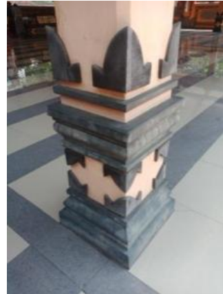
Gambar 3. Kolom