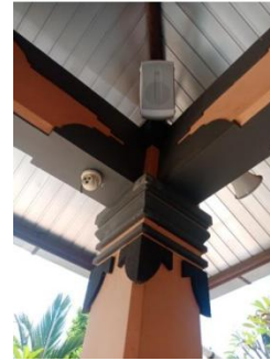
Gambar 7. Sambungan Balok