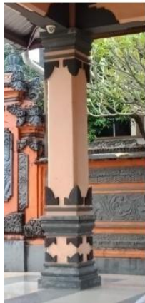
Gambar 2. Pondasi

Pondasi bangunan utama kemungkinan menggunakan pondasi garis. Pada bagian atasnya dilapisi dengan coran semen yang dibentuk sedemikian rupa membentuk motif khas arsitektur Bali.