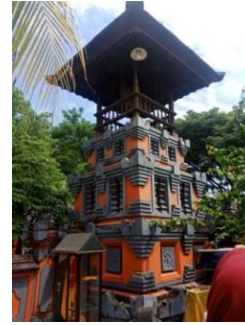
Gambar 15. Balai Kul-Kul Sumber : Olah data lapangan

Selain tempat penyimpanan dan balai kul-kul , di area Nista Mandala terdapat bangunan tambahan lainnya seperti aula atau gedung serbaguna untuk tempat pertemuan, sekolah, dan asrama. Serta terdapat tempat penyembahan patung Dewa Ganesa.