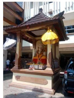
Gambar 19. Ruang Kelas Mingguan