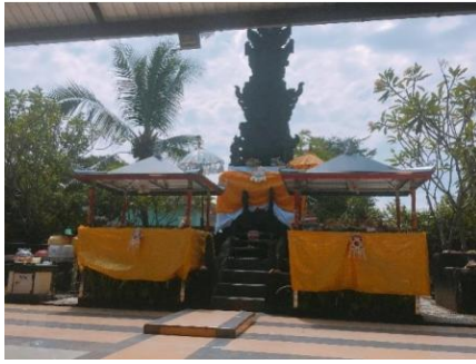
Gambar 10. Patsana