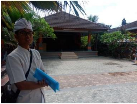
Gambar 14. Tempat Penyimpanan