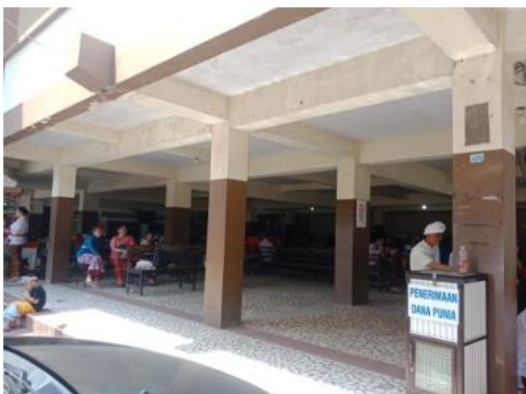
Gambar 4. Kolom

Di bangunan utama terdapat 4 kolom yang berfungsi sebagai penyangga atap yang membuat seluruh beban bangunan akan meneruskan ke pondasi. Terdapat motif khas Bali yang menghiasi kolom. Dimensi kolom pada bangunan utama ini adalah 20 x 20 cm. Dengan jarak tiga meter antar kolom.