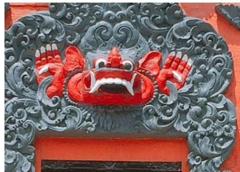
Gambar 13. Kalamakara