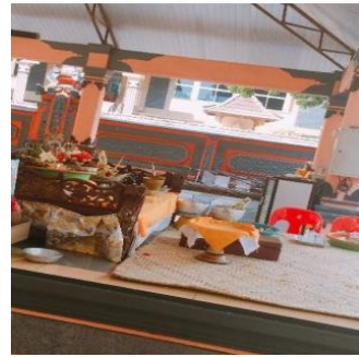
Gambar 11. Tempat Panite

Pada saat memasuki Utama Madya terlebih dahulu di percikkan air suci baik kepada agama Hindu maupun non Hindu. Terdapat tiga pintu saat memasuk Utama Madya, pintu di tengah hanya dapat di lewati oleh orang suci dan terbuka pada saat upacara sedangkan untuk pintu samping dapat dilalui oleh semua umat Hindu yang akan bersembahyang maupun non Hindu. Terdapat pula simbol di pintu yaitu boma dalam bahasa Bali dan yang lebih dikenal kalamakara yang berarti penunjuk waktu. Selain itu juga terdapat empat arca yang secara umum berarti sebagai penetralisir negative- negative sebelum sembahyang dan setiap arca memiliki nama dan arti yang berbeda- beda.