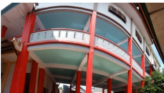
Gambar 18. Ruang Kelas Mingguan