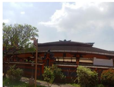
Gambar 9. Sambungan Balok