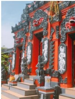
Gambar 12. Pintu tempat Sembahyang

Pada saat memasuki Utama Madya terlebih dahulu di percikkan air suci baik kepada agama Hindu maupun non Hindu. Terdapat tiga pintu saat memasuk Utama Madya, pintu di tengah hanya dapat di lewati oleh orang suci dan terbuka pada saat upacara sedangkan untuk pintu samping dapat dilalui oleh semua umat Hindu yang akan bersembahyang maupun non Hindu. Terdapat pula simbol di pintu yaitu boma dalam bahasa Bali dan yang lebih dikenal kalamakara yang berarti penunjuk waktu. Selain itu juga terdapat empat arca yang secara umum berarti sebagai penetralisir negative- negative sebelum sembahyang dan setiap arca memiliki nama dan arti yang berbeda- beda.