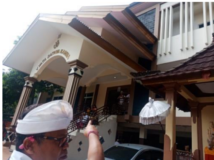
Gambar 16. Aula Sumber : Olah data lapangan

Selain tempat penyimpanan dan balai kul-kul , di area Nista Mandala terdapat bangunan tambahan lainnya seperti aula atau gedung serbaguna untuk tempat pertemuan, sekolah, dan asrama. Serta terdapat tempat penyembahan patung Dewa Ganesa.